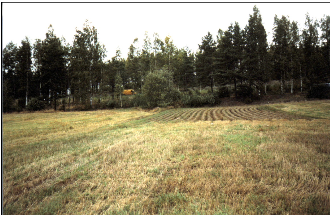
Kuvattu syksyllä 2001 pohjoiseen, ns. yläpellon alaosasta.