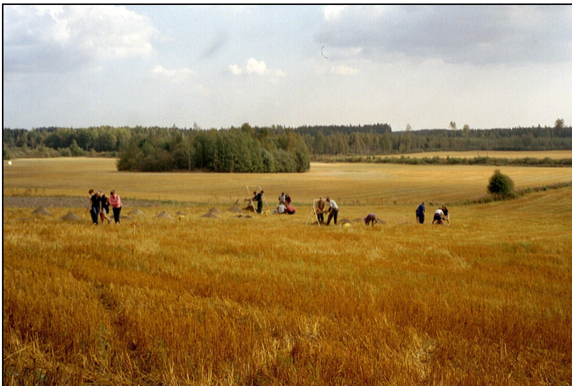
Kuvattu koilliseen pellon yläreunasta. Koealoja seulotaan.