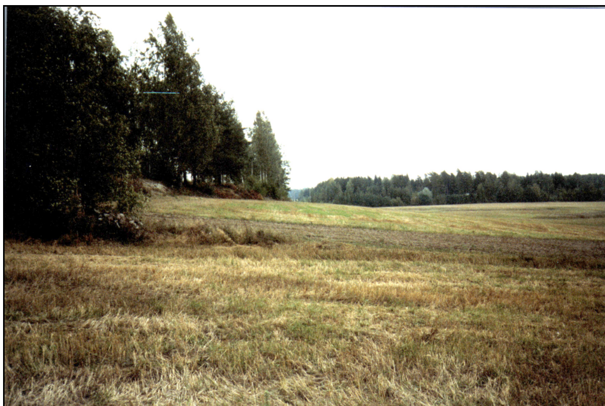
Kuvattu itään syksyllä 2001